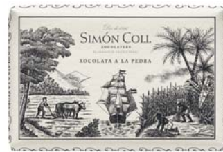
Chocolate a la Piedra 45% Original 200g Ref: 1134