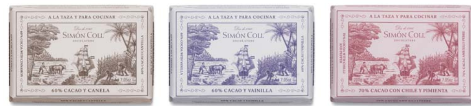
Chocolate a la Piedra 60% Canela 200g Ref: 5592 Chocolate a la Piedra 60% Vainilla 200g Ref: 5593 Chocolate a la Piedra 70% Chili y Pimienta 200g Ref: 5594