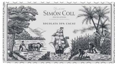
Chocolate 50% Cacao 200g Ref: 1470