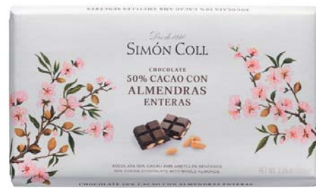
Chocolate 50% con Almendras Enteras 200g Ref: 7993