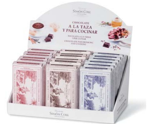
Expositor Surtido Chocolate a la Piedra 18u 3.600g Ref: 5595