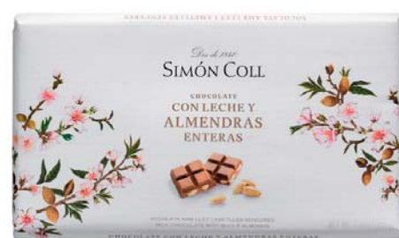
Chocolate con Leche con Almendras Enteras 100g Ref: 7994