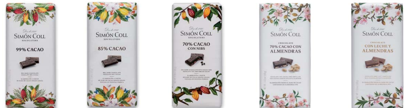
Chocolate 99% 85g Ref: 5566 Chocolate 85% 85g Ref: 5565 Chocolate 70% con Nibs 85g Ref: 5567 Chocolate 70% con Almendras 100g Ref: 1267 Chocolate con Leche y Almendras 100g Ref: 1268