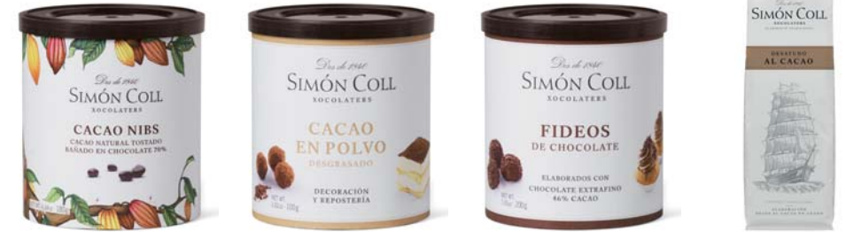
Cacao Nibs 180g Ref: 5644 Cacao en Polvo 100g Ref: 5646 Fideos Chocolate 46% 200g Ref: 5645 Chocolate a la Taza Barco 28% 200g Ref: 1245