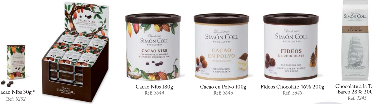
Cacao Nibs 30g* Ref: 5232 * Puede contener trazas de Gluten