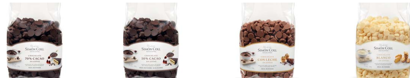
Gotas Choc 70% B500g Ref: 6945 Gotas Choc 50% B500g Ref: 5596 Gotas Choc Leche B500g Ref: 6946 Gotas Choc Blanco B500g Ref: 5597