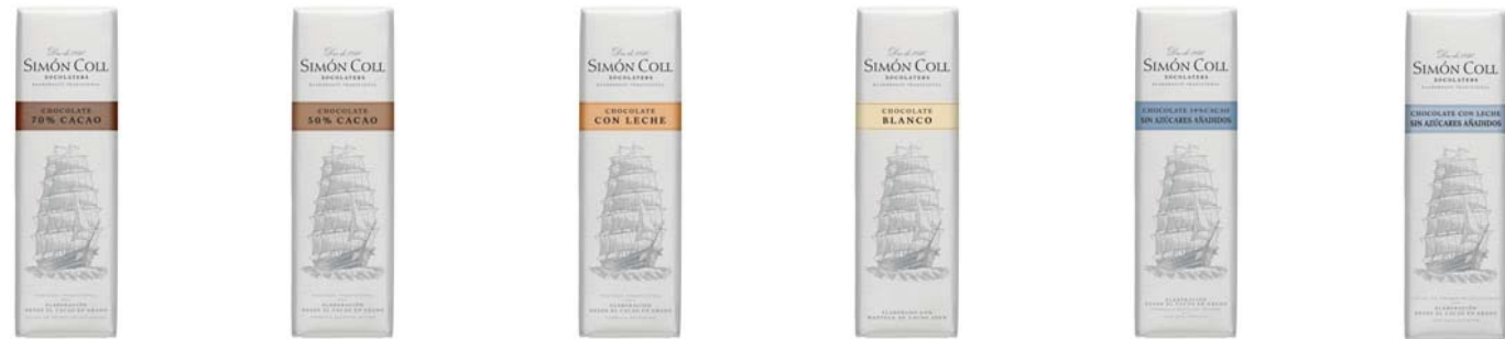
Chocolate 70% 18g Ref: 6139 Chocolate 50% 18g Ref: 6020 Chocolate con Leche 18g Ref: 6019 Chocolate Blanco 18g Ref: 6021 Chocolate 54% Sin azúcares añadidos 18g Ref: 6404 Chocolate 54% Sin azúcares añadidos 18g Ref: 6405