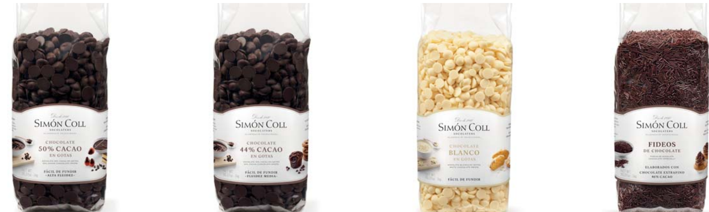
Gotas Choc 50% Blkg y Caja 10kg Ref 1kg: 8539 Ref 10kg: 4020 Gotas Choc 44% Blkg y Caja 10kg Ref 1kg: 8538 Ref 10kg: 4110 Gotas Choc Blanco Blkg Ref: 8540 Fideos Choc 45% Blkg Ref: 4100