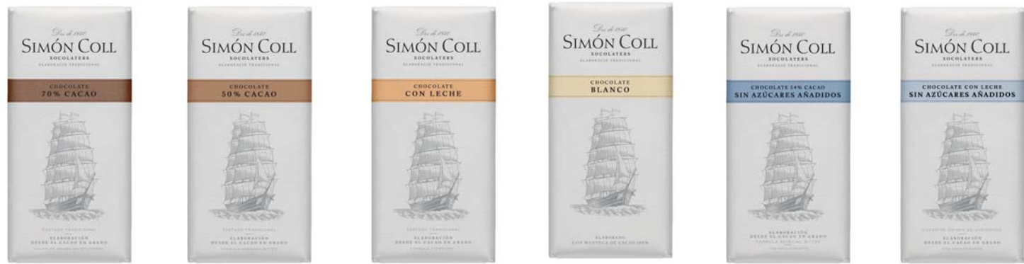
Chocolate 70% 85g Ref: 6262 Chocolate 50% 85g Ref: 1104 Chocolate con Leche 85g Ref: 1105 Chocolate Blanco 85g Ref: 6261 Chocolate 54% Sin azúcares añadidos 85g Ref: 6406 Chocolate con Leche Sin azúcares añadidos 85g Ref: 6407