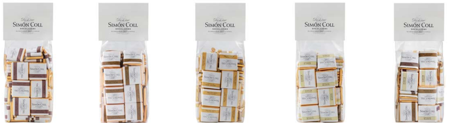
Napolitanas 70% 5g B100 Ref: 8754 Napolitanas 50% 5g B100 Ref: 8755 Napolitanas leche 5g B100 Ref: 8753 Napolitanas Blanco 5g B100 Ref: 8756 Napolitanas surtidos 5g B100 Ref: 8758